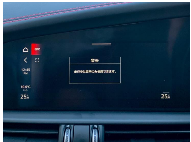
図2. TVチューナーからの視聴制限警告