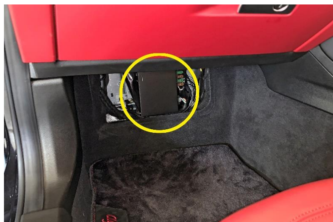
図3. TVチューナーユニット