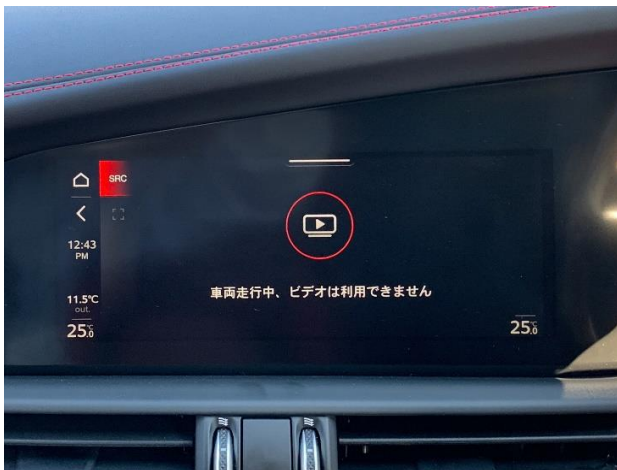
図1. ナビユニットからの視聴制限警告

タッチパネルモニター&純正地デジチューナー搭載車両では、当初は「図1ナビ側」の視聴制限だけでしたが、途中から「図2TVチューナー側」の視聴制限警告が追加されており、有無の見分けはつかなくなっています。