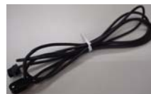
スイッチ ハーネス