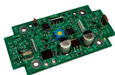
広帯域周波数変換ユニット