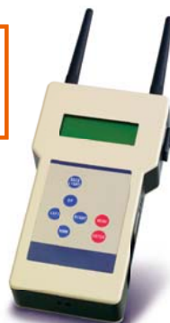
無線温度センサー