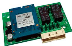
無線リモコン受信機