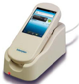
ハンディ Android ターミナル